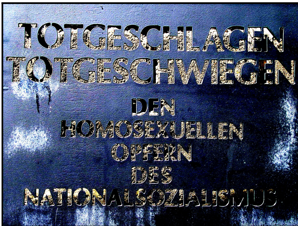
Gedenktafel in der KZ-Gedenkstätte Sachsenhausen, farblich bearbeitet