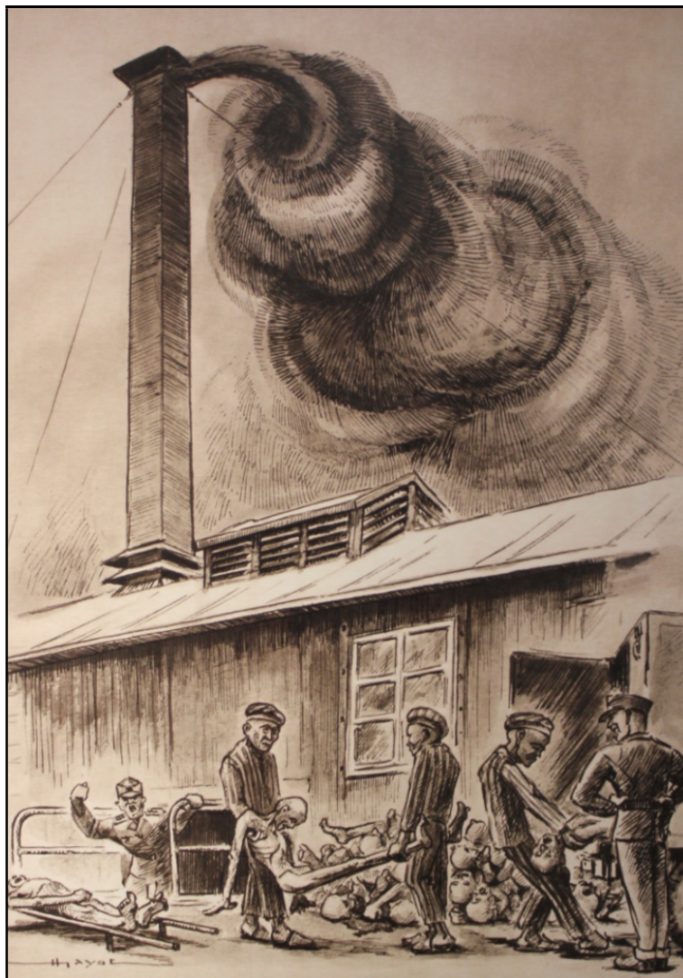
Aus dem KZ Natzweiler: Häftlingskunst. Der Kamin des Krematoriums raucht. Gesehen in der Gedenkstätte Natzweiler-Struthof